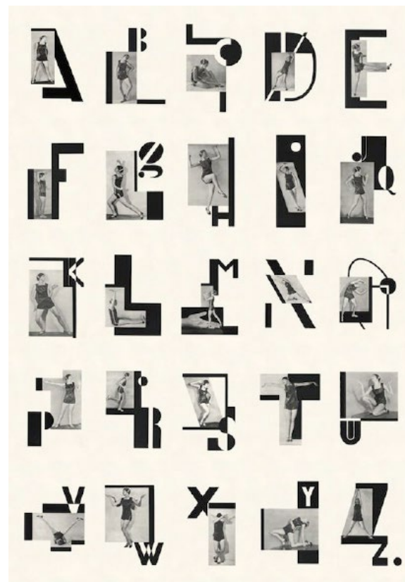
Vítězslav Nezval, Milča Mayerová, Karel Teige - ABECEDA, 1926